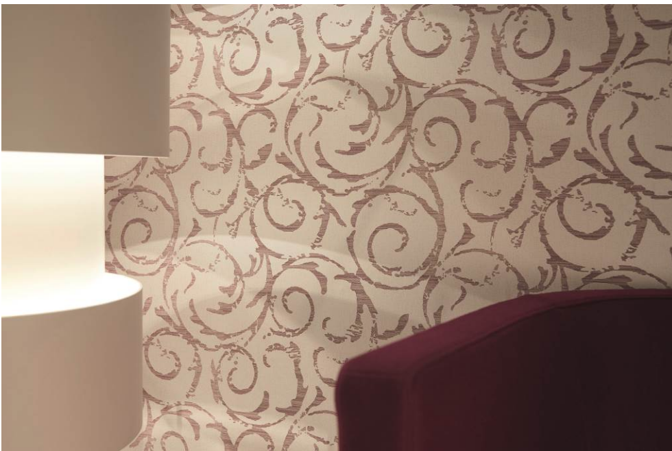
Erismann-Kollektion Cassiopeia / Vliesdirektdruck in stylischen Beerentönen