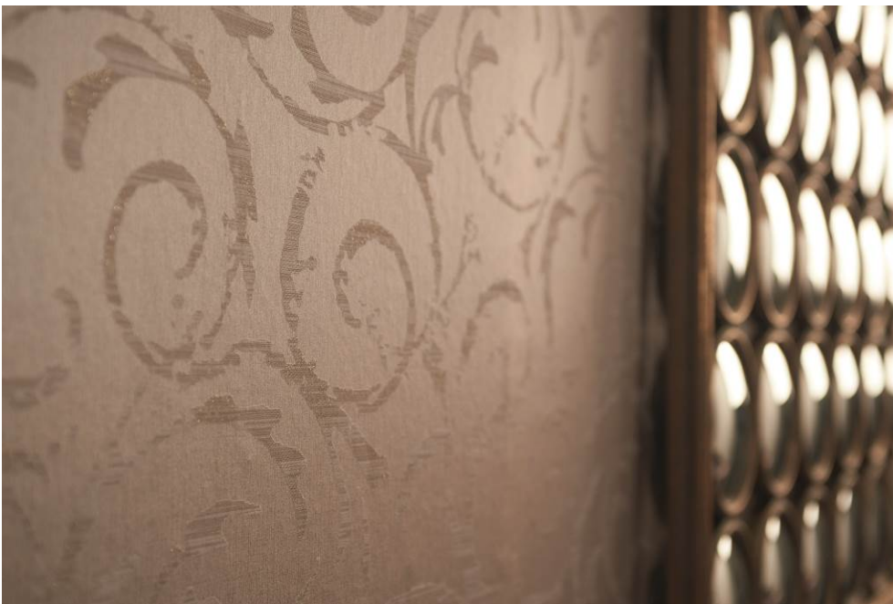
Erismann-Kollektion Cassiopeia / Elegantes Tapetenmuster direkt auf hochwertiges Vliesmaterial gedruckt.