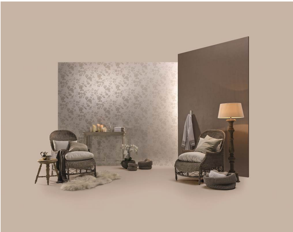
Erismann-Kollektion Cassiopeia / Romantische Blüten aus Glasperlen glitzern verführerisch