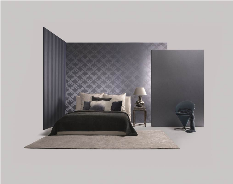
Erismann-Kollektion Cassiopeia / Ein klassisches Ornament mit Glasperlen auf hochwertigem Vliesmaterial.