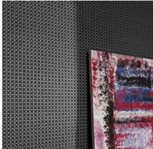
Erismann-Kollektion VISIO / grafische Muster wie aus Leinenstoff gewebt