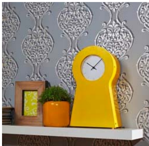
Erismann-Kollektion VISIO / Kunstvoll ausgearbeitete Ornamente erzeugen eine grafische Plastizität