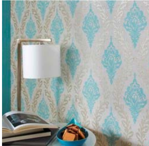
Erismann-Kollektion VISIO / weiche Farben, zarter Glanz