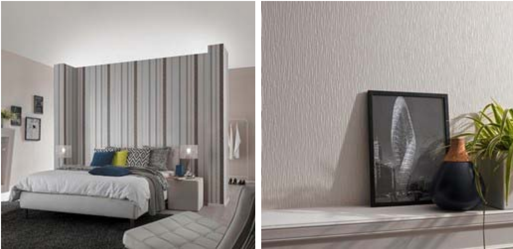
Erismann-Kollektion VISIO / modern-behagliche Wohnatmosphäre in Perlgrau