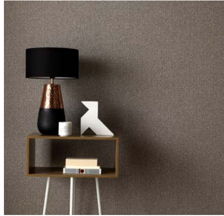
Erismann-Kollektion Shine / Behagliche Raumatmosphäre in Kaffeebraun