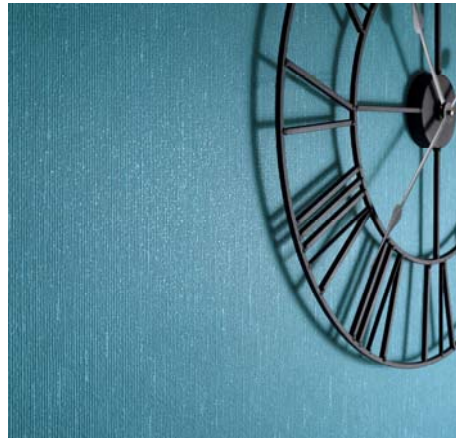
Erismann-Kollektion Shine / Frisch und modern - gediegenes Petrol