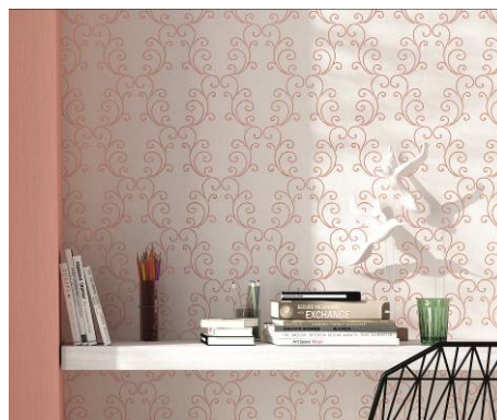
Erismann-Kollektion Ophelia / Sinnliche Ornamente in Copper Orange