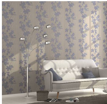
Erismann-Kollektion Ophelia / Chices Panel-Motiv in trendigem Jeans-Blau