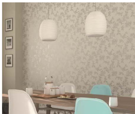
Erismann-Kollektion Ophelia / Schlichte Eleganz Ton-in-Ton mit zartem Glanzeffekt