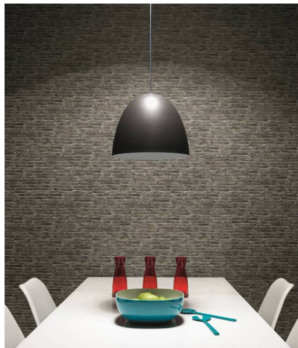
Erismann-Kollektion Authentic / Mit Holz und Stein - urig gemütlich oder cooler Chic