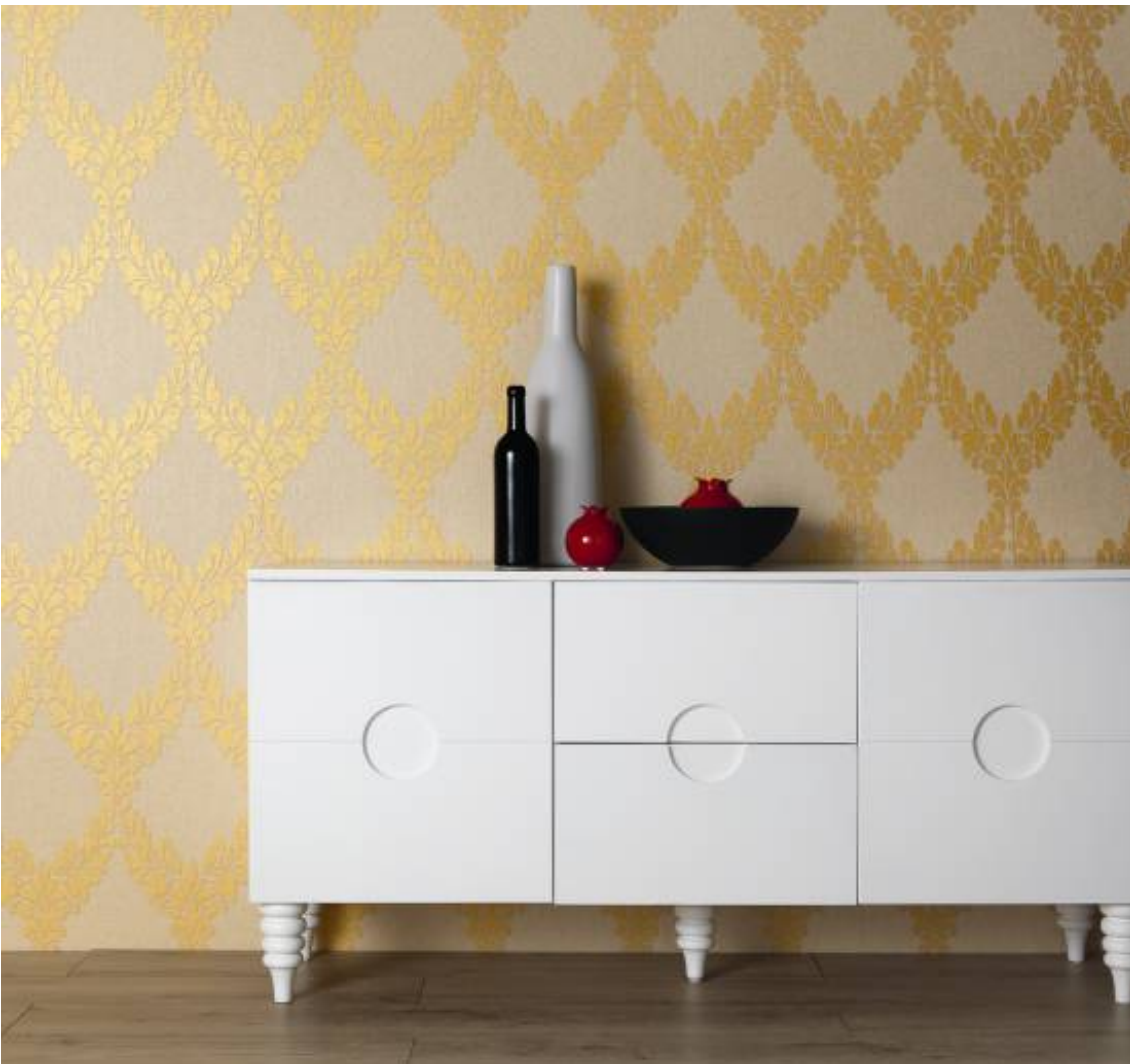
Erismann-Kollektion Hommage: Luxuriöses Ornament mit Goldeffekt