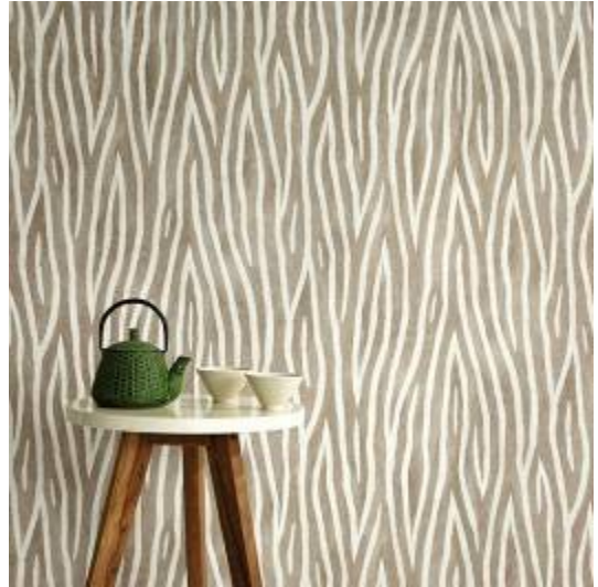
Erismann-Kollektion Sambesi / Natur Pur - Wohnlich wild