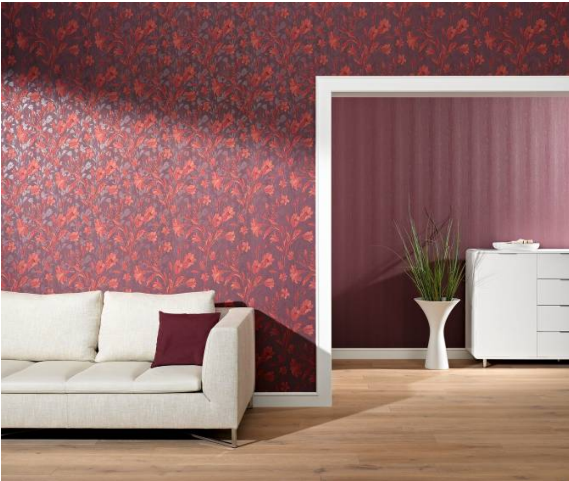
Erismann-Kollektion Rubinia / Eine extravagante Mischung: magisches Rot, klare Linien