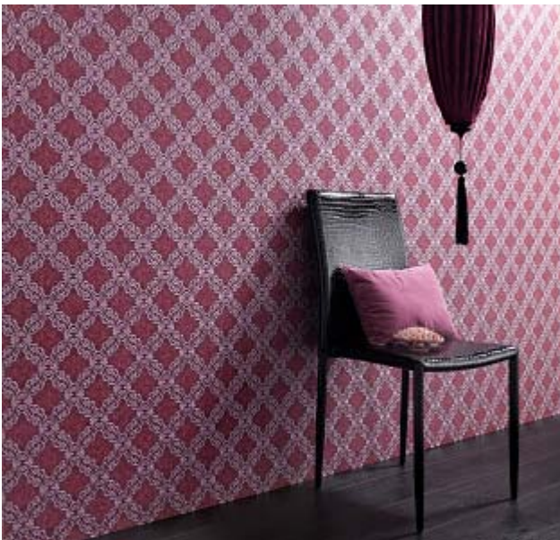
Erismann-Kollektion Delia / Elegant und tiefgründig - verspielte Ornamentik in betörendem Rot.