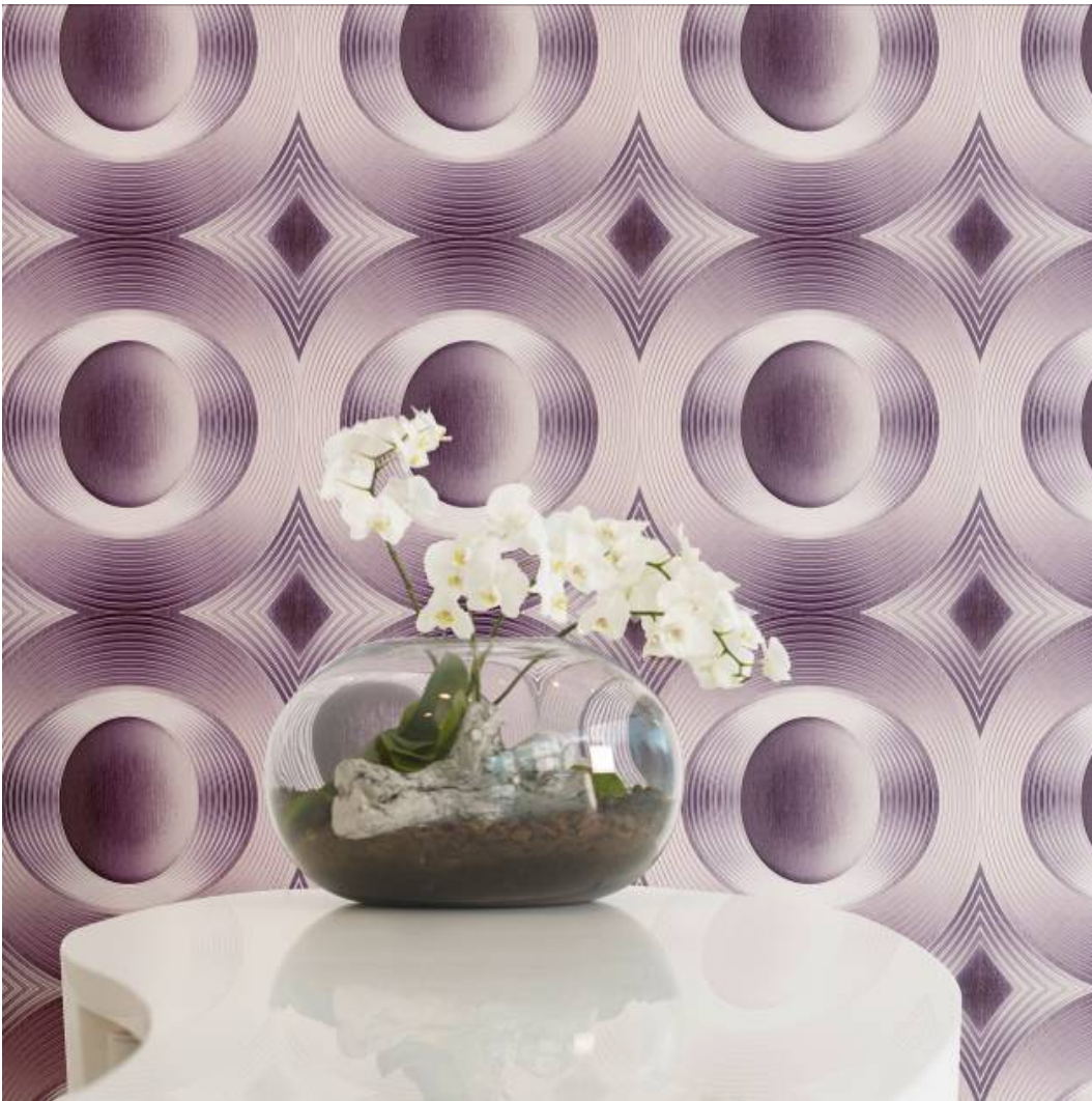
Erismann-Jubiläumskollektion One Seven Five / Großzügiges 3D-Kreismotiv mit raffiniertem Farbenspiel in Aubergine-Silber.