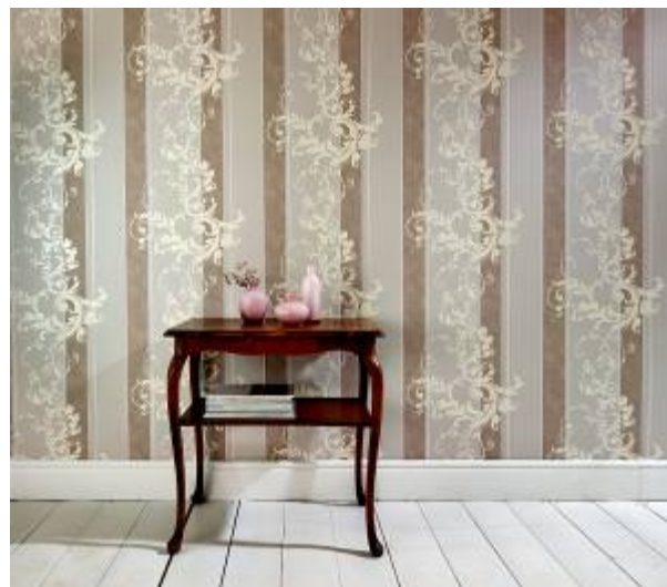
Erismann-Kollektion Myself: Introvertierter Wohnstil in zarten Nude-Nuancen.