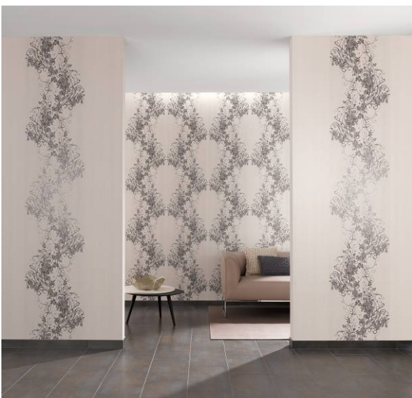
Rubinia: Üppige Blütenranken