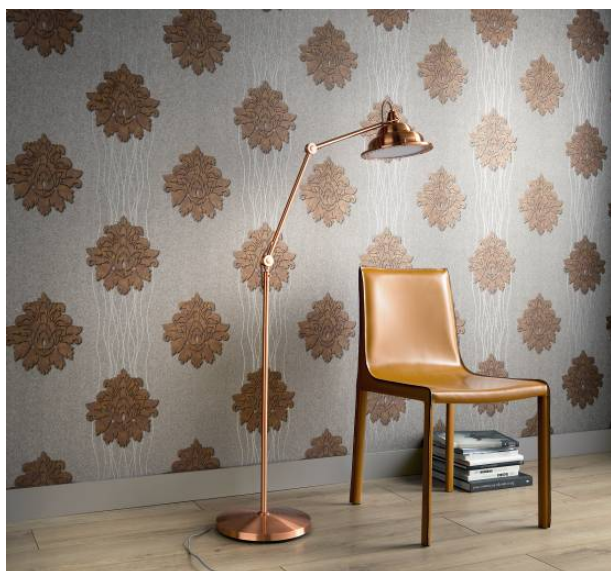
Hommage: Großflächige Ornamentik